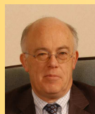
Président Délégué Départemental Du Finistère - 29 Jean-Bernard SOLLIEC